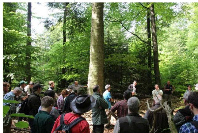
ErdmannWald - Waldgebiet des Jahres 2022 - 8 ha reine Natur 130 Jahre Waldbau auf natürlicher Grundlage